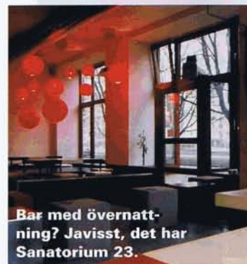
Bar med övernattnings? Javisst, det har Sanatorium 23.

Sommarens populäraste vattenhål är strandbarerna. De är ca 15, ligger vid vattnet med fin vitkornig sand eller brygga.