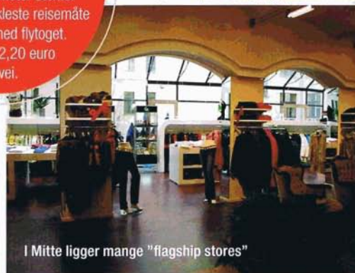
I Mitte ligger mange "flagship stores"