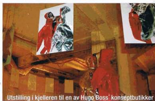
Utstilling i kjelleren til en av Hugo Boss' konseptbutikker