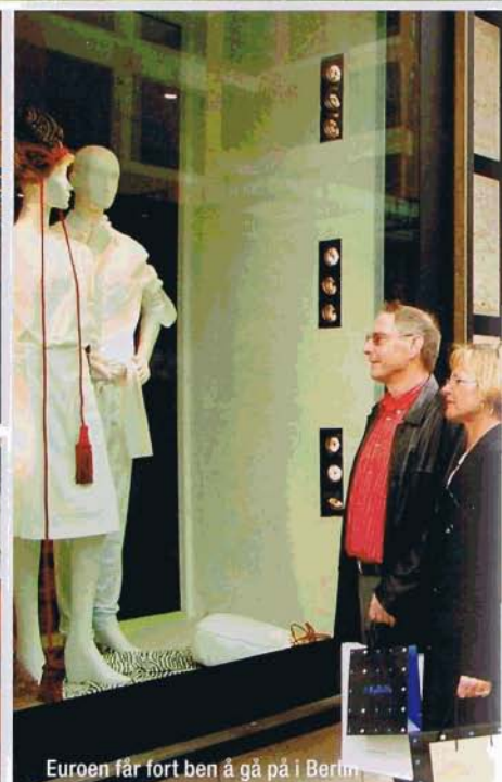
Euroen får fort ben å gå på i Berlin