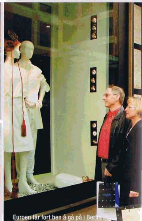
Euroen får fort ben å gå på i Berlin