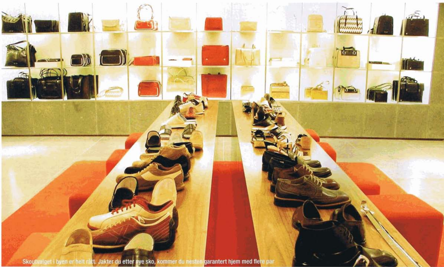
Skoutvalget i byen er helt rart. Jakter du etter nye sko, kommer du nesten garantert hjem med flere par

Et av de mest kjente er KaDeWe, Europas største varehus på sju etasjer, som selger alt fra klær og sko til vaskemaskiner og matvarer. Alle de eksklusive merkene finnes her og utvalget er ikke mindre enn enormt. Hvis du ikke har tid eller ork til å ta for deg alle etasjene, anbefaler vi i hvert fall å