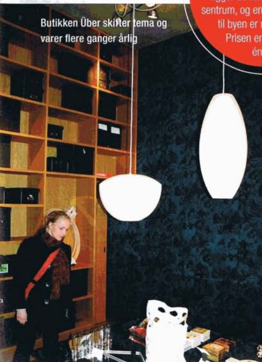
Butikken Über skifter tema og varer flere ganger årlig