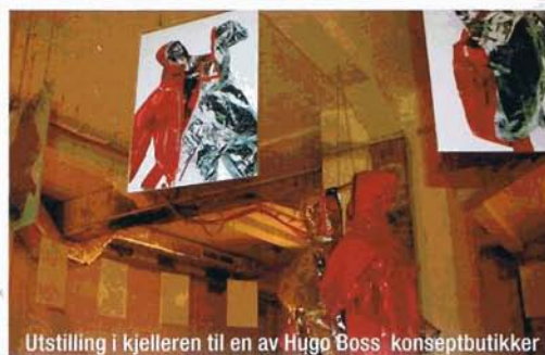
Utstilling i kjelleren til en av Hugo Boss' konseptbutikker