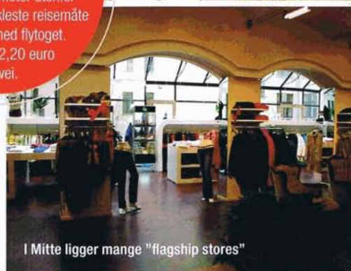
I Mitte ligger mange "flagship stores"