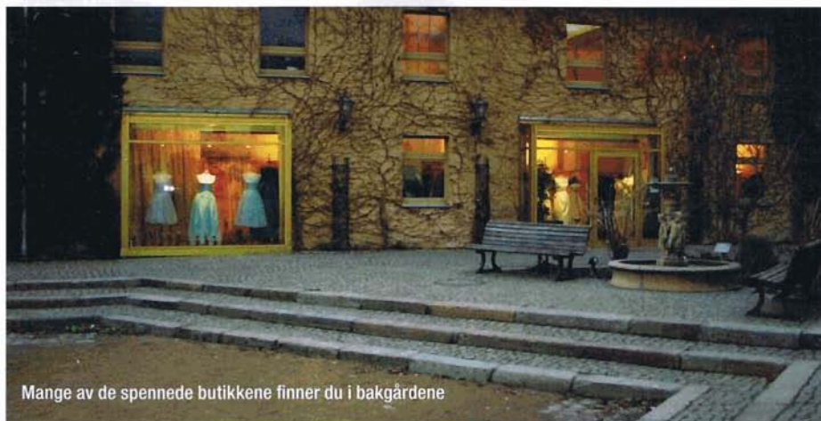
Mange av de spennede butikkene finner du i bakgårdene

- Alt er lov, vær deg selv, tøy grensene. Og dette handler ikke om å være kulest, hippest eller å ha de dyreste merkene. Det handler om det motsatte - å finne sin egen greie, om du så ser stygg, pen eller ukorrekt ut. Og uansett hva du gjør, vil du aldri oppleve å nå "toppen", for det er alltid noen som har kulere image enn deg eller er mer outrert. Slik er det mulig å opprettholde et samfunn der individualiteten hylles.