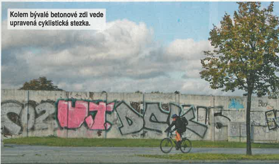
Kolem bývalé betonové zdi vede upravená cyklistická stezka.

Tato část Berlína platila za centrum kultury již od 19. století, kdy Friedrich Vilém IV. založil Svobodný ústav pro umění a vědu. Od neblahých třicátých let 20. století však budovy chátraly a teprve po roce 1989 se dočkal areál velkorysé renovace za miliony eur. V budoucnu by měla všechna muzea propojovat tzv. architektonická promenáda s novými výstavními síněmi, nádvořími a zaklenutými prostory.