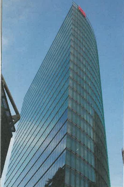
Na Postupimském náměstí si každý připadá jako v New Yorku.