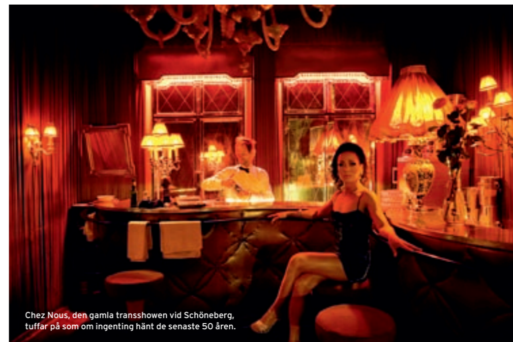
Chez Nous, den gamla transshowen vid Schöneberg, tuffar på som om ingenting hänt de senaste 50 åren.

Det ettrigt unga medvetna trashankeriet och de ivrigaste trend-spröten, som just nu har sin hype främst i Friedrichshain, är kanske inte mitt mest inpinkade revir. Men en promenad från Ostbahnhof, kanske en dos Karl-Marx-Allee, ett litet gästspel hos stadens yngsta kafésociety längs Simon-Dach-Strasse, och vidare mot favoritbron Oberbaumbrücke, känd från filmen Spring Lola , ingår numera i min nya Berlinritual. Här får man också spana in nya Media City, med allt det hopp som staden har till företag som Universal Music och MTV i häftiga gamla industrilokaler.