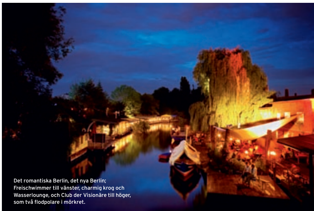
Det romantiska Berlin, det nya Berlin; Freischwimmer till vänster, charmig krog och Wasserlounge, och Club der Visionäre till höger, som två flodpolare i mörkret.

är ju bubblan som sprack, den största pr-bluffen och medieankan någonsin, eller snällare – drömmen som kraschade.