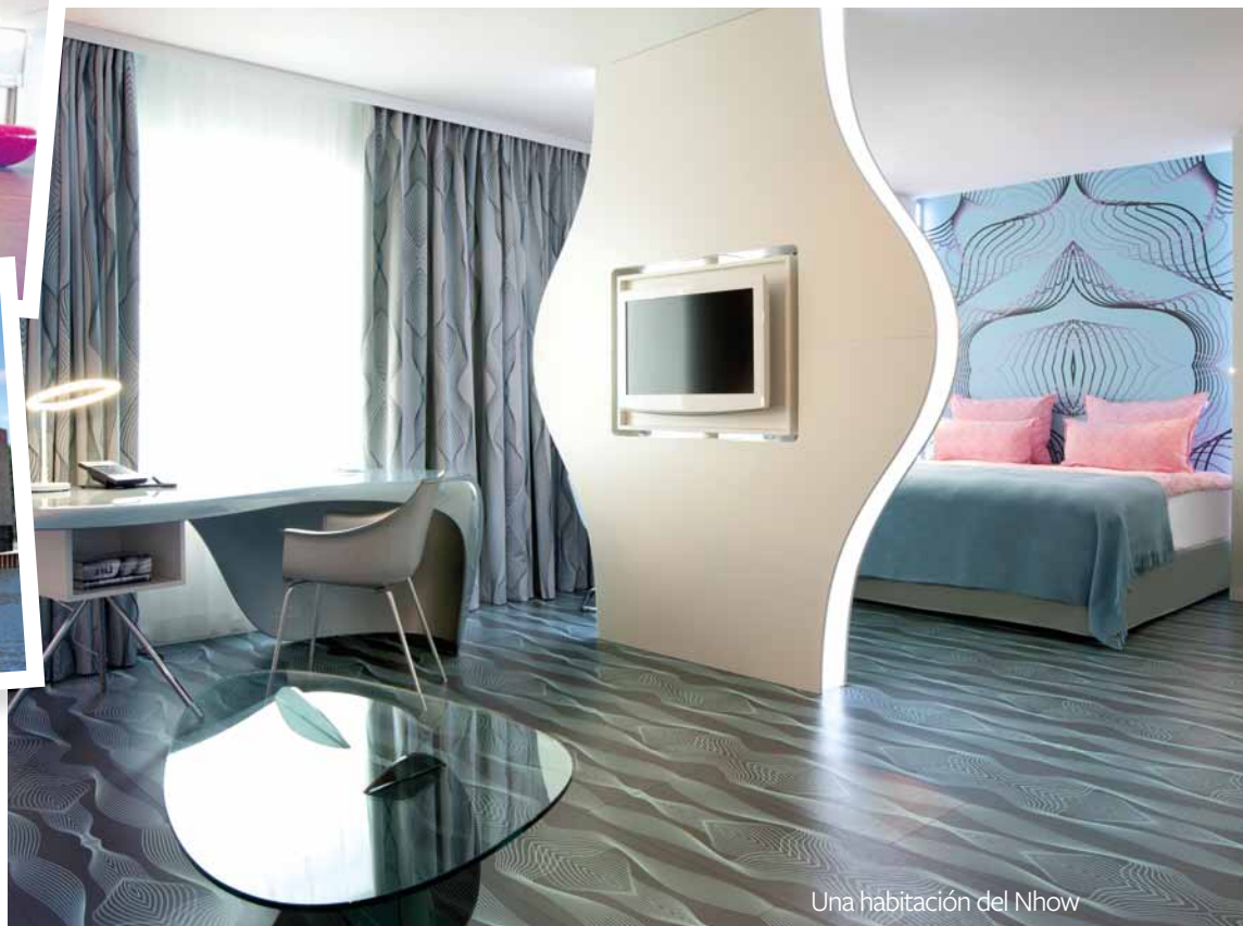
Una habitación del Nhow

* Parte del edificio del hotel Nhow parece pendular sobre las aguas del río Spree.