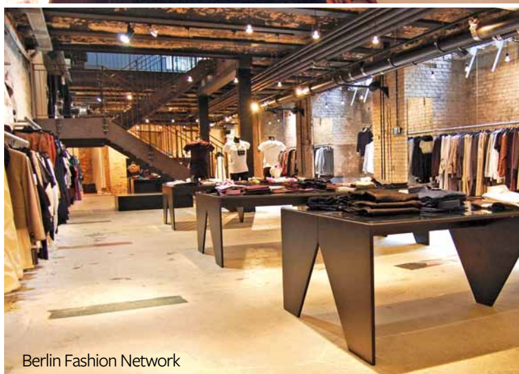
Berlin Fashion Network