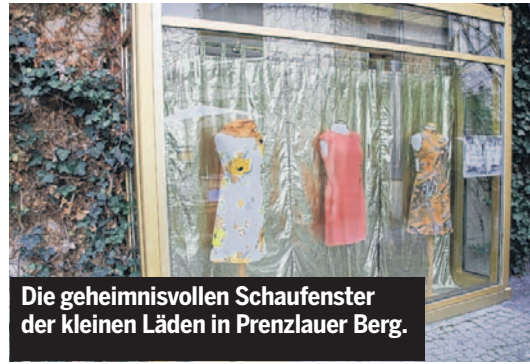
Die geheimnisvollen Schaufenster der kleinen Läden in Prenzlauer Berg.

Und wer von Berlinagent Henrik die Wegbeschreibung bekommt: «In Berlin Mitte geht ihr zwischen Komischer Oper und Westing Grand Hotel durch einen Hinterhof, vorbei an Abfallbergen bis in die hinterste Ecke und durch eine Tür.»