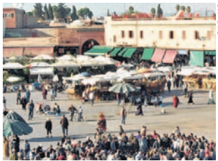
Schauspiel pur: Djemaa el-Fna.