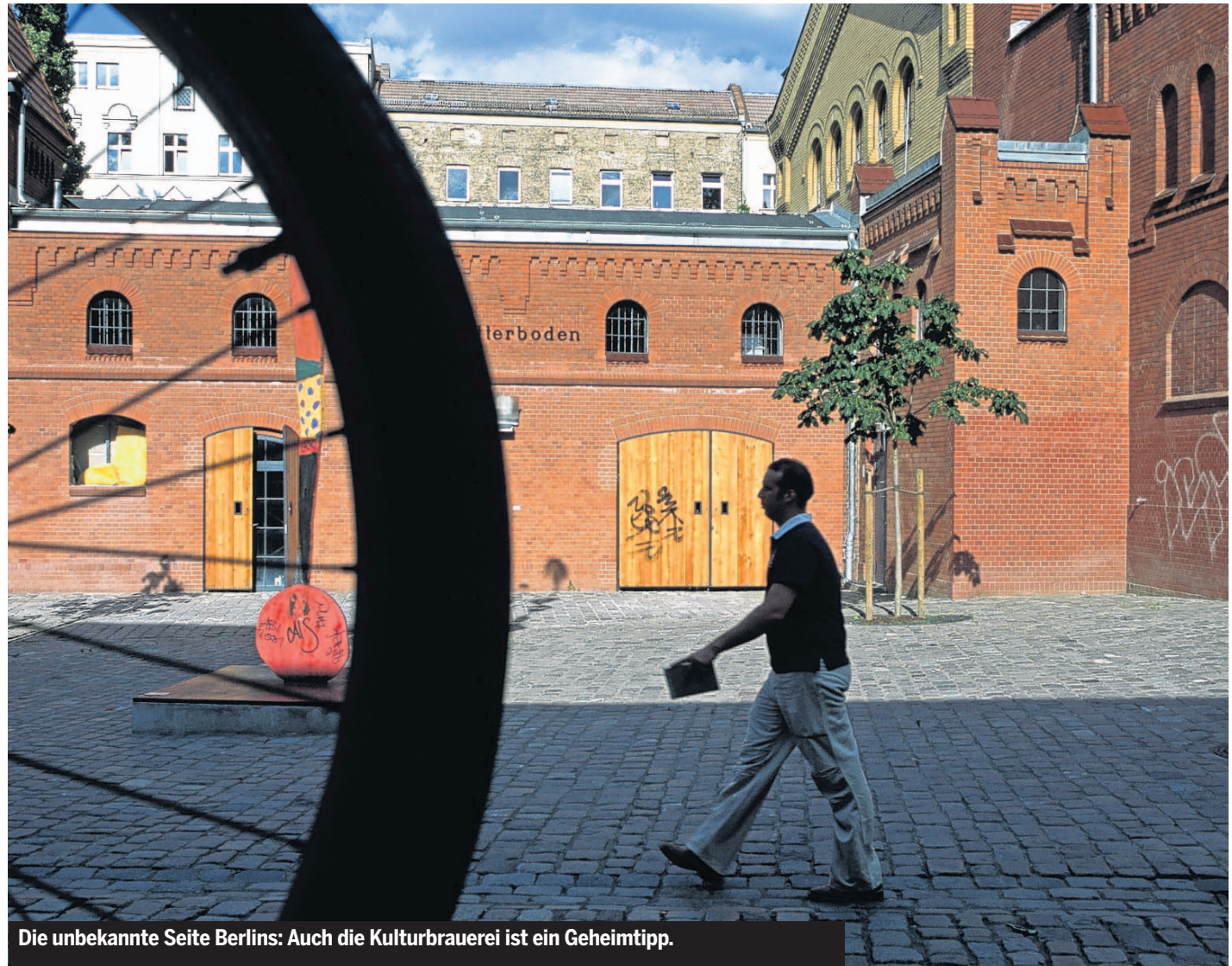
Die unbekannte Seite Berlins: Auch die Kulturbrauerei ist ein Geheimtipp.

SO WIE DER EINSTIGE KLUB in einem Kohlekeller, in welchen man nur über eine Kohlerutsche gelangte. Oder «Cookies». Der Klub eines Berliners mit dem gleichen Spitznamen. Seit das «Cookies» 1994 zum ersten Mal in der Szene von sich reden machte, wechselte es sechsmal die Location – leerstehende Gebäude mit maroden Treppenhäusern oder hinter Bauzäunen. Nur wer neugierig und abenteuerlustig ist, kommt hinein.